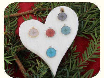
Farbsortiment der Fassungen

Jedes unserer Schmuckstücke kann mithilfe eines integrierten NFC-Chips mit dem Smartphone gescannt werden. Der NFC-Chip ist in einer handgefertigten Metallfassung eingesetzt und mit farbigem Epoxidharz versiegelt. Beim Scan wird jede Kundin und jeder Kunde direkt auf seine bzw. ihre persönliche Erinnerungsseite weitergeleitet, die eigenständig über LIORAs selbst entwickelte Plattform Memry erstellt wird. Dort können persönliche Erinnerungen wie Fotos, Videos, Songs oder Links sicher gespeichert , übersichtlich organisiert und jederzeit abgerufen werden. Die persönliche Seite lässt sich zudem mithilfe individueller Design-Vorlagen, Farbauswahlen, Schriftarten frei personalisieren. Alternativ können die Schmuckstücke auch unabhängig von Memry genutzt und selbst mit Inhalten wie eigenen Playlists, Fotoalben oder anderen Links bespielt werden. Das LIORA-Sortiment umfasst Armketten, Halsketten und Anhänger , die jeweils mit oder ohne integrierten NFC-Chip erhältlich sind. Ergänzend stellt LIORA verständliche Erklärvideos und ausführliche Tutorials bereit, zum Beispiel zum eigenständigen Hochladen von Inhalten. So ermöglichen wir unseren Kundinnen und Kunden eine kreative und einfache Nutzung unseres Smart-Schmucks.