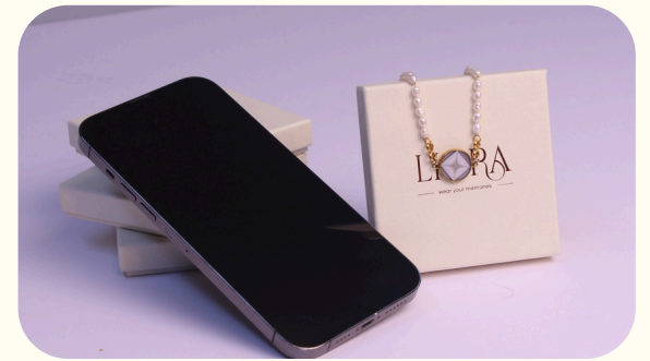
Produktfoto mit Smartphone und Verpackung

LIORA möchte eine Welt schaffen, in der Menschen ihre wertvollsten Erinnerungen in einzigartigem Schmuck verewigen und diese Momente jederzeit nah bei sich tragen können. LIORA gestaltet Schmuck, der mehr ist als nur ein Accessoire. Es bewahrt die schönsten Erinnerungen auf. Als persönliches Geschenk ist es Ausdruck echter Wertschätzung, denn es macht die Zeit, Mühe und Emotionen sichtbar, die ins Gestalten einer persönlichen Erinnerungsseite fließen.